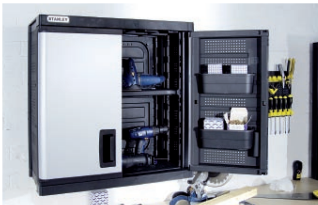
DULAP DE PERETE W2 16"