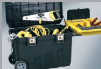
Lada pentru unelte