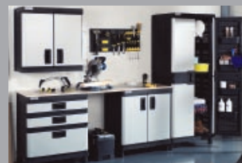
Dulapuri cu aranjare modulara