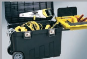
Кутии на колела 256