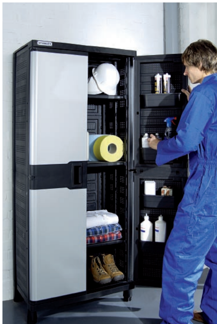
ТЗ 20'' ШКАФ ЗА ИНСТРУМЕНТИ С ПОЛИЦИ XL