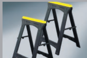
Магарета и маси за работилница 270