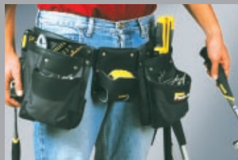
Джобове и колани за инструменти 252