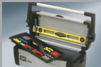
Кутии за инструменти 260