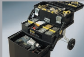
Подвижни работилници 258