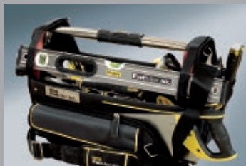
Чанти за инструменти 247