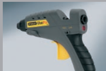
Pistol electric cu adeziv tip baton