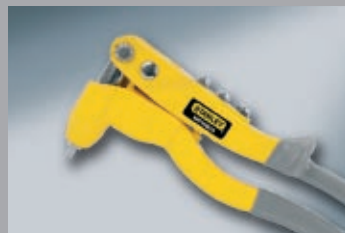
Cleste cu nituri pop