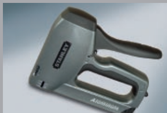
Pistoale de capsat